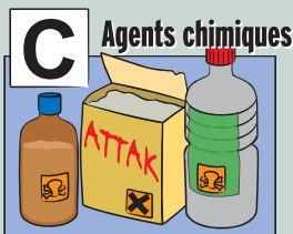
Illustration Thierry Bel

Le classement des locaux décline pièce par pièce et à travers huit catégories de bâtiments (habitat individuel et collectif, commerces, enseignement...), l'ensemble des usages courants en France. Quatre notions sont retenues :